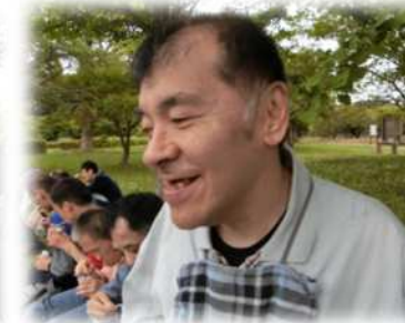
自然に癒されます♡