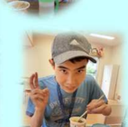
美味しくてピース！！