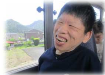
5丁目ご利用者も一緒に♪