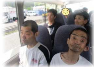
どこに行くのかな