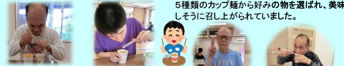
温かいうちに頂きます

5月28日に余暇の充実のため、おやつとしてカップ麺を提供し召し上がっていただきました。5種類のカップ麺から好みの物を選ばれ、美味しく召し上がられていました。