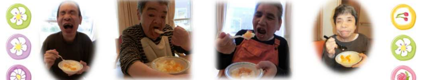
自然と笑みがこぼれます(^_^)

5月17日にフルーツ寒天牛乳ゼリーを作られました。材料を混ぜたり、果物を器に入れたりされ、皆さん笑顔で楽しそうに取り組まれました。