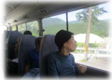
外の景色に夢中です