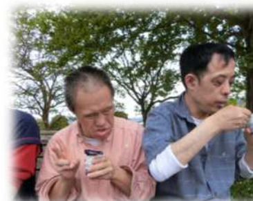
外で食べるおやつは最高！！