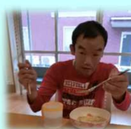
麺も上手に食べられます