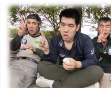
同じグループの仲間でピース